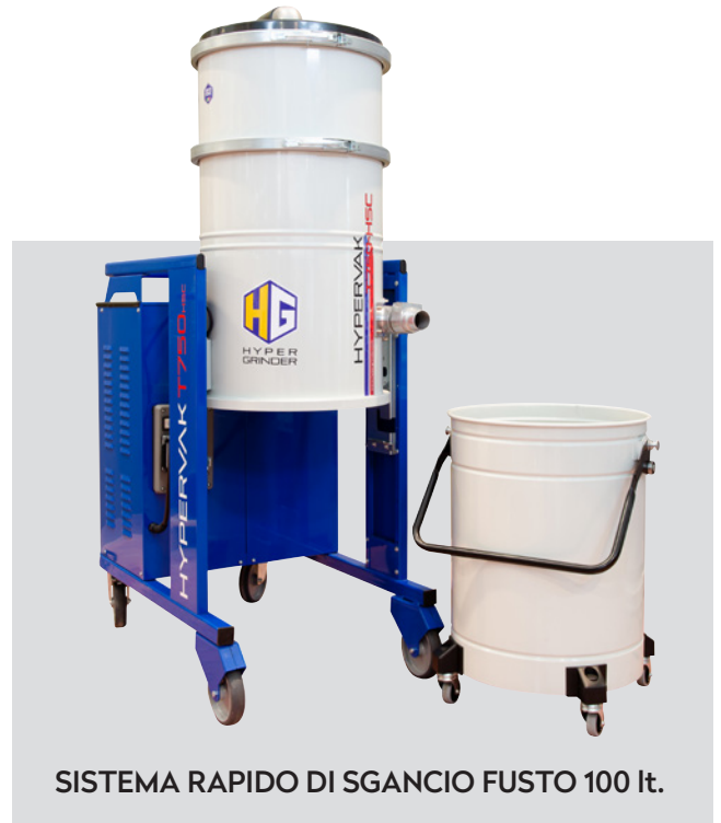
SISTEMA RAPIDO DI SGANCIO FUSTO 100 lt.