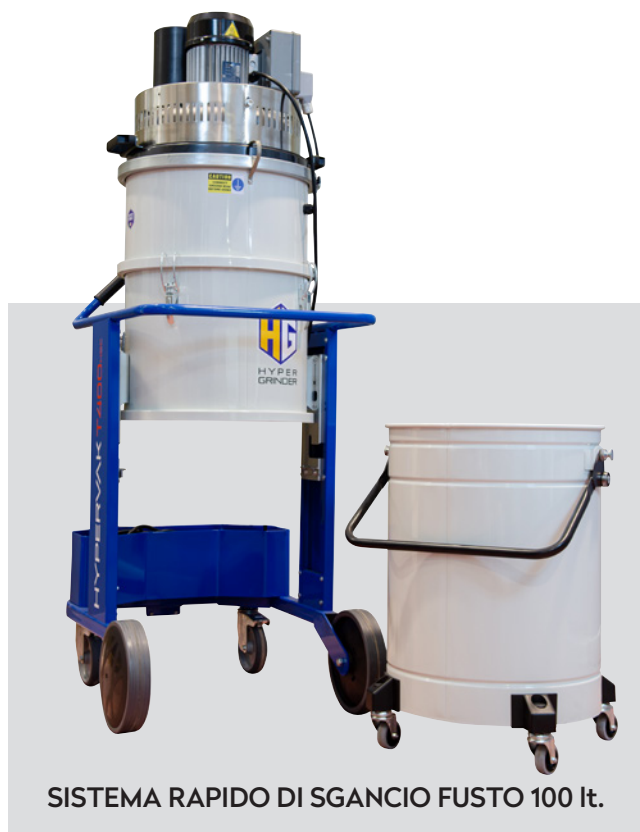
SISTEMA RAPIDO DI SGANCIO FUSTO 100 lt.